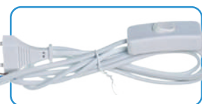
Сетевой шнур (1,8 м)